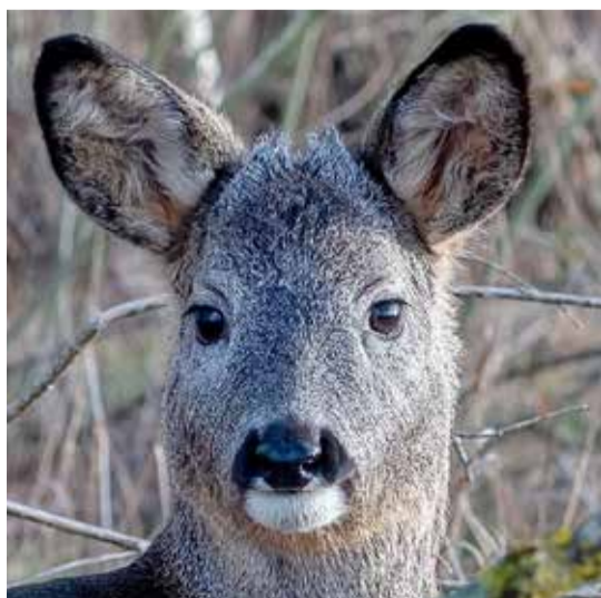
Mõtskitsi ek kapru om prilla Mulgimaal pallu.