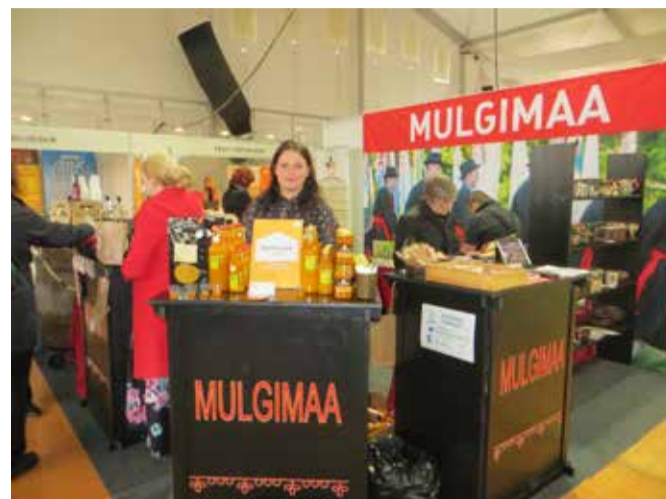
Joba enne liidu luumist käisive väikse Mulgi ettevõtte ütenkuun messe pääl. Pilt om tettu 2018. aaste Maamessil Tartun.

Üits suur tüü om liidul kah oma Mulgi müügiseinä luumine ja puutes saamine.