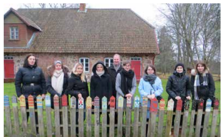
Tartu Ülikooli mulgi keele õpja ja õpeteje Eimtali muuseumi man kindakirjalise aia taga.