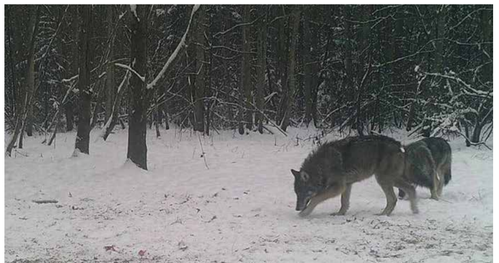
Nii undi jäive rajakaamera pildi pääle novembre lõpuotsan Tarvaste kandin.