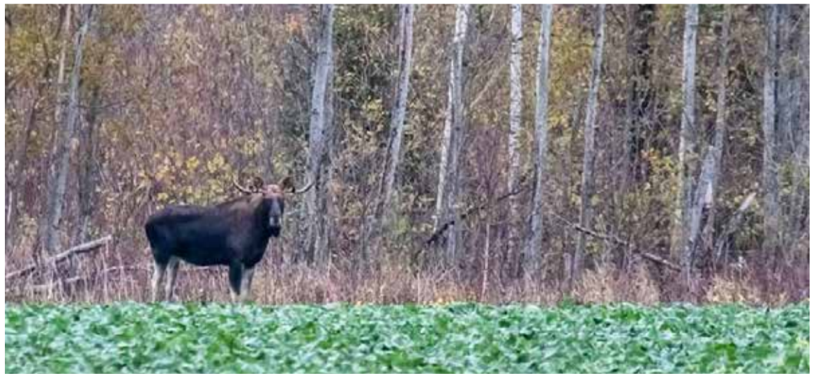
Põdra võive ennest nüid julgembelt tunda, sest põdrajaht om ses talves läbi.