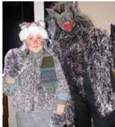
Mineve sügüse nätti Abja kandin siandsit märdisante.