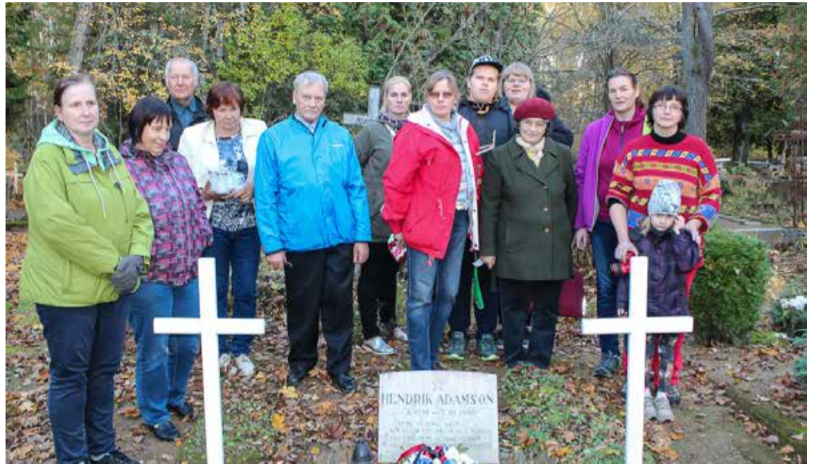
Murdevilise ei istu pallald sihen raamatide taga. Pildi pääl om Tõrva murderingi liikme 2018. aaste oktoobrikuul Elme surnuaian õppekäigul.