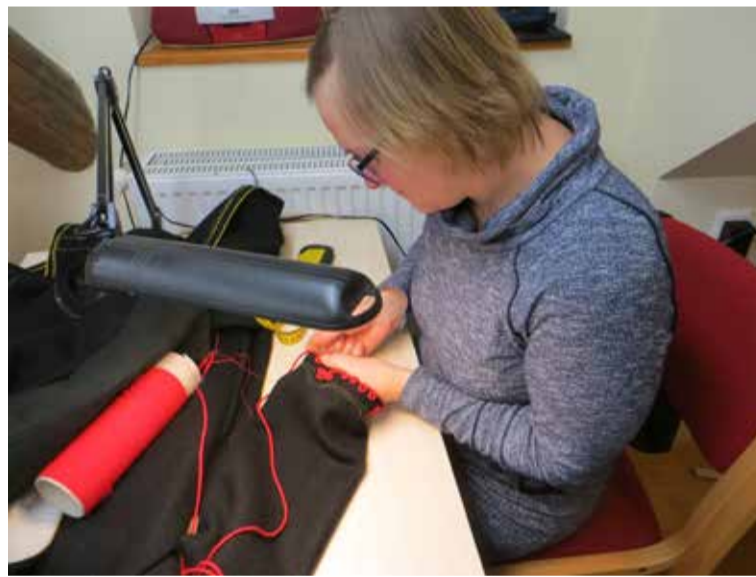
Kige rohkemb aiga ja vaiva kulup kaaruspagla tegemise ja päälepaneku jaos.

Vastu talve akassivegi kuvve järgemüüdä valmis saama. Uvve kuvve tuvvas rahva ette 25. jaanuaril, ku peetes Tarvastu käsitüükoan 10. sünnipäevä.